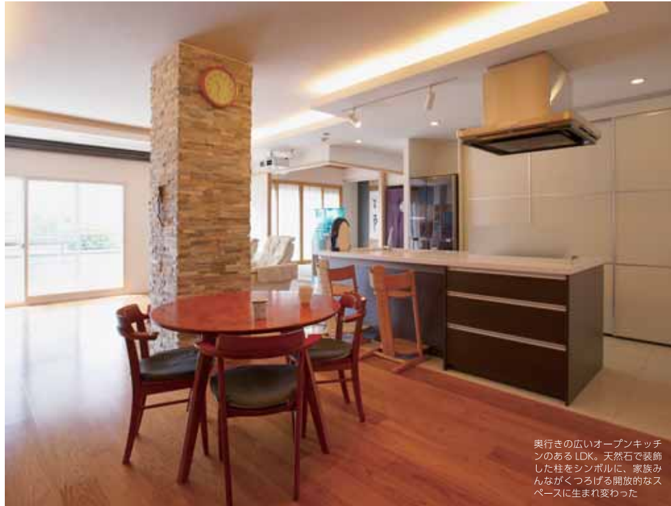
奥行き広いオープンキッチンのあるLDK。天然石で装飾した柱をシンボルに、家族みんながくつろげる開放的なスペースに生まれ変わった

数あるリフォーム会社の中でも大手に数えられる東京ガスリモデリング。その特徴は設計、施工、アフターフォローに至るまで、じつにきめ細かく、顧客の立場に立ったリフォームを行うことにある。このようにして、「快適」「満足」など、目に見えない重要な要素を引き出しているのだろうか。