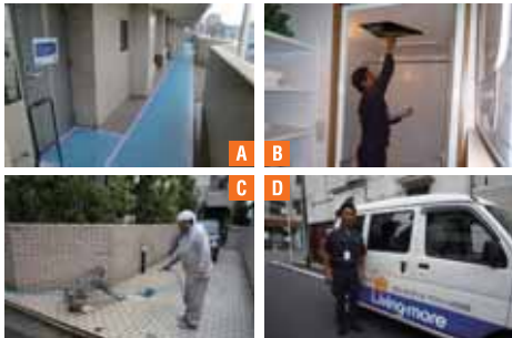
Aマンションでのリフォームでは、共用部分の養生もしっかり行う。B完了検査は入念に。C現場の清掃、あいさつなどマナーも徹底。D担当者による3ヵ月点検のほか、1年点検は本社の専任スタッフ、ホームドクターが実施